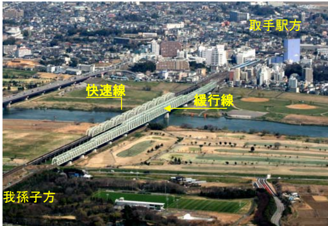
我孫子方から取手方を望む